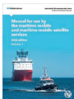
海上移動業務及び 海上移動衛星業務で使用する便覧 2024年版