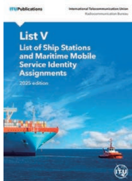
船舶局局名録 2025年版