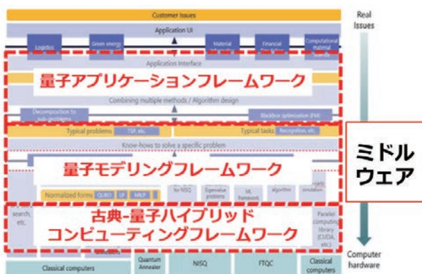
■ 図5. Q-STARが開発したソフトウェアスタック図

JTC 3への今後の参画にあたり、WG 12での日本のリーダーシップを最大限に生かし、産業ユースケースレベルでのベンチマークやミドルウェアインタフェースの標準化の推進を通じて、各国から日本への共感と信頼を集め、日本の強みを生かす形でのエコシステム形成を通じた量子社会の実現に貢献していく所存である。