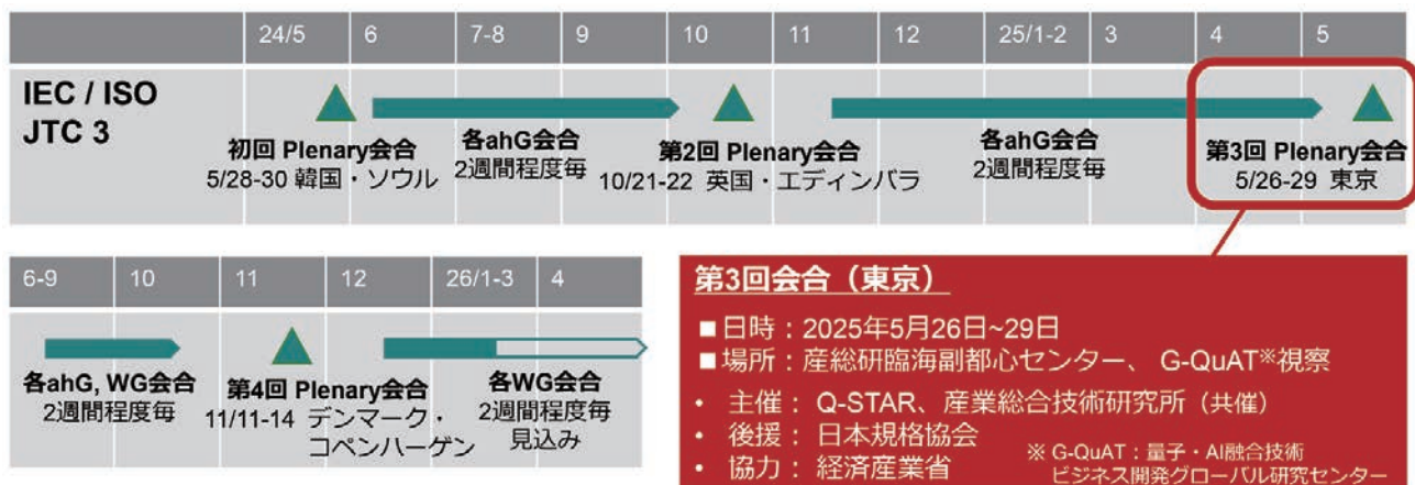
■図3. JTC 3会合の実績